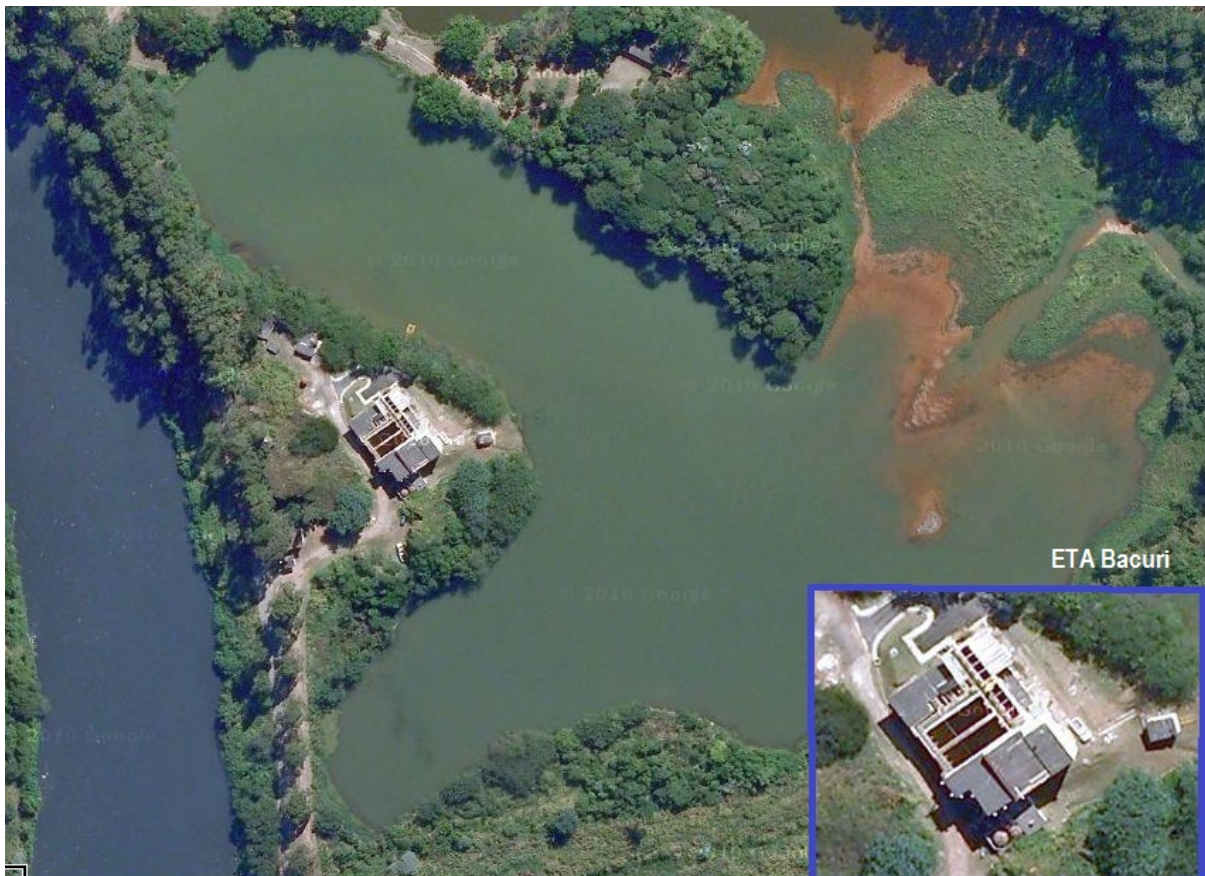
Imagem aérea com a localização da ETA Bacuri.

Na figura abaixo, é possível observar, através da imagem de foto aérea, a localização da ETA Bacuri e o reservatório de onde a água bruta é captada.