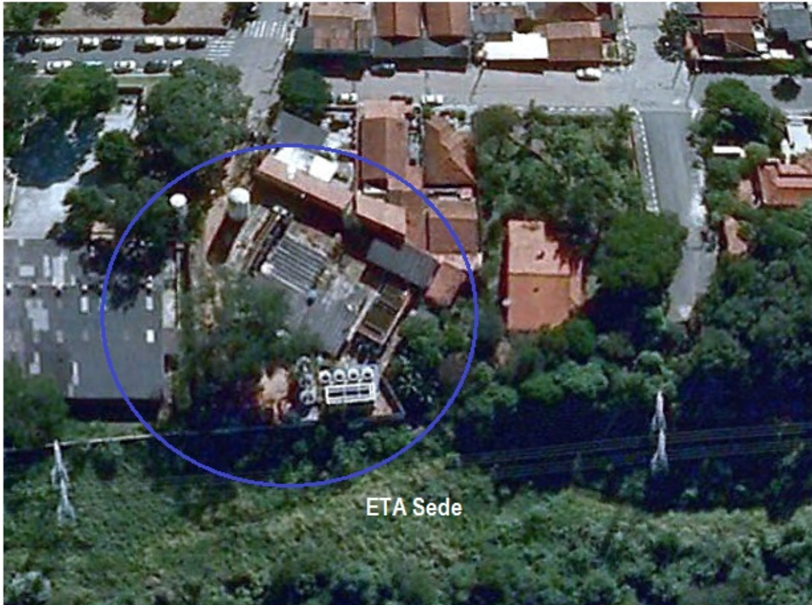
Figura 1 - Imagem aérea com a localização da ETA Sede.