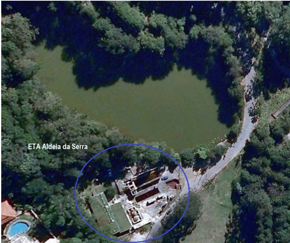
Imagem aérea com a localização da ETA Aldeia da Serra.