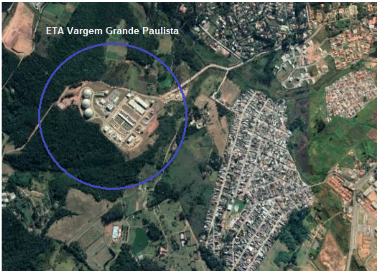
Figura X - Imagem aérea com a localização da ETA Vargem Grande Paulista.

mesma é transportada pelo SAM e distribuída para diversos Municípios, dentre os quais, Santana de Parnaíba, que, neste caso, a reservação é realizada nos reservatórios Barueri-Tamboré e Barueri-Centro.